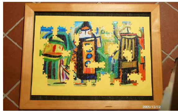
Stand: 17-4-06 - 117 Puzzleteilchen