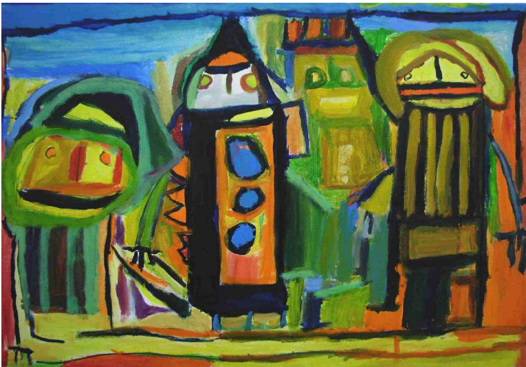
Menschen wie du und ich, von Dieter Marmarowsky Und hier der Künstler bei der Arbeit: