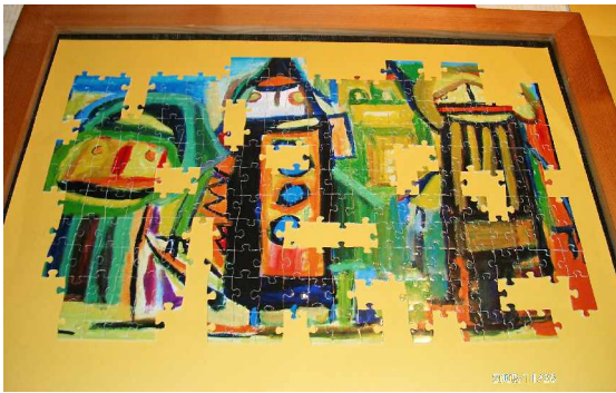
Stand: 12-12-05 - 83 Puzzleteilchen